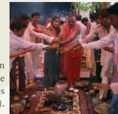
Al costat, família celebrant un sacrifici, a la província de Gujart (Índia). A sota, joves budistes (Índia).

És una gran oportunitat per eliminar les situacions de discriminació per raons d'intolerància religiosa i si des de la laïcitat de l'estat es respecta la llibertat de cada individu sense que això comporti cap discriminació del dret a la igualtat.