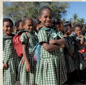
Al costat, nenes al pati d'una escola de Port Moresby (Papua Nova Guinea). A sota, nens de l'escola Sant Jordi de Sant Vicenç dels Horts.

Un dels objectius fixats pel sistema de les Nacions Unides és el d'universalitzar l'educació primària el 2015 i augmentar un 50% l'alfabetització de les persones adultes. L'educació ha de ser el motor del canvi social.