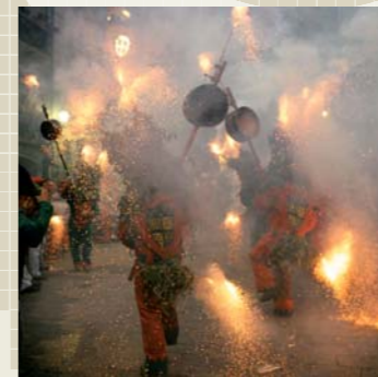
A sobre, salt de Mases plenes de la Patum del 2004 (Berga). Al costat, buda destruïda a Bamiyan (Afganistan). A sota, la ciutat de Verona (Itàlia).

Els conjunts i béns patrimonials catalans que figuren en la llista del Patrimoni Mundial de la UNESCO són: l'obra d'Antoni Gaudí (1984-2005), el monestir de Santa Maria de Poblet (1991), el Palau de la Música i l'Hospital de Sant Pau (1997), el conjunt de les pintures rupestres de la costa llevantina (1998), el conjunt monumental de Tarragona i les esglésies de la Vall de Boí (2000) i la Patum de Berga (2005), l'únic exemple de patrimoni immaterial.