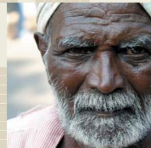
Al costat, retrat d'indi. A sota, grup d'avis catalans i jove xinès.

Per evitar el procés de reducció de la diversitat lingüística és necessari engegar processos de revitalització de les llengües minoritzades potenciant l'educació multilingüística. Els exemples de països com el Quebec i Catalunya, reconeguts internacionalment, són paradigmàtics pel que fa a la immersió lingüística duta a terme en l'ensenyament obligatori.