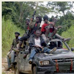
Al costat, soldats adolescents (Liberia). A sota, pagès regant un camp (Tailàndia) i immigrants al barri del Raval (Barcelona).

S'ha d'aprofitar l'oportunitat de la diversitat per enriquir-nos i construir una societat més rica i plural, perquè totes les cultures són iguals en dignitat i totes i cadascuna són patrimoni de la humanitat.