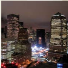
A sobre, vista nocturna de Nova York (Estats Units). Al costat, el riu Canaima (Veneçuela).

Disposem de molts recursos però estan mal repartits; repartir-los i consumir-los de manera adequada i sostenible és el gran repte del nou segle que exigeix polítiques globals, com per exemple una nova cultura de l'aigua o la potenciació de les energies renovables.